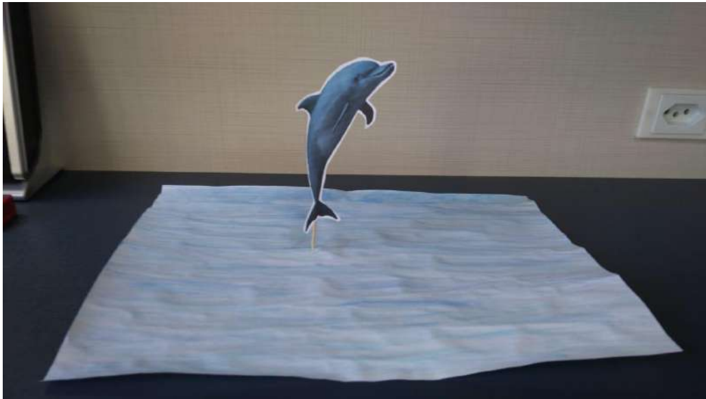
Golfinho pulando sobre o mar