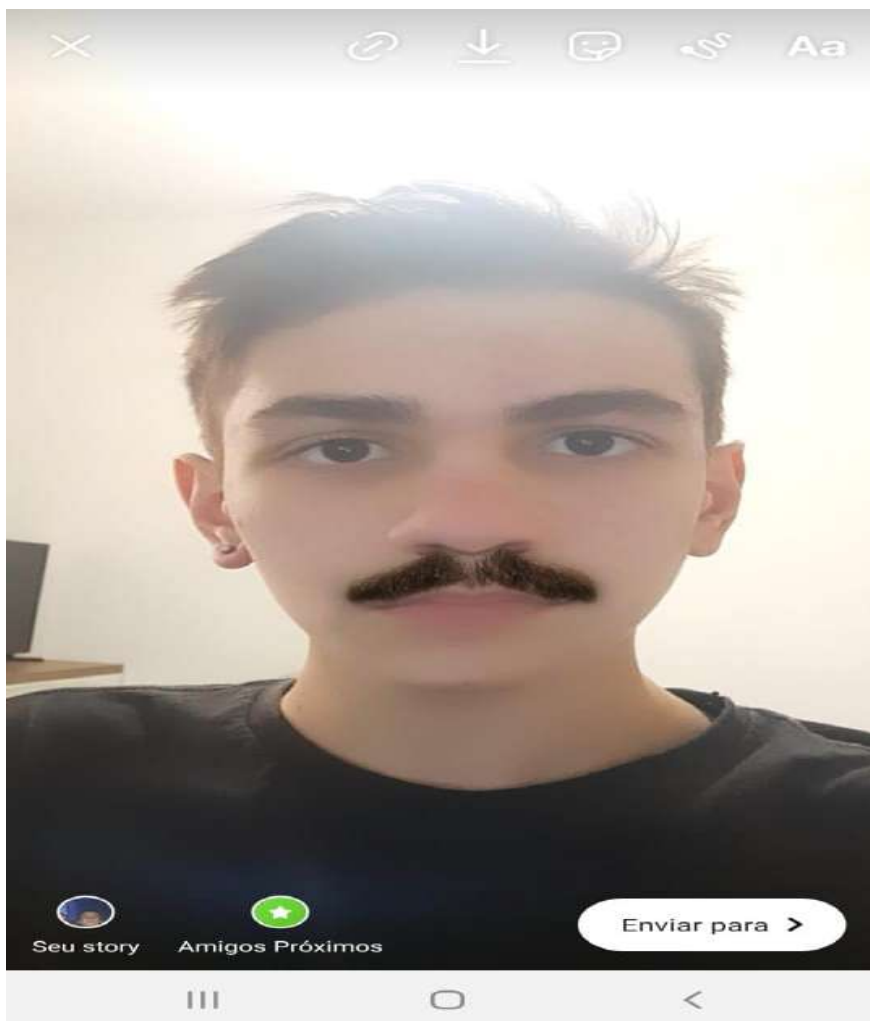
Foto da primeira semana da quarentena onde eu cortei o meu cabelo "curto" pela primeira vez, pois que achei que ia durar bastante (mas não tanto quanto está durando) foi quando eu coloquei meu brinco novamente, coloquei esse efeito de bigode pois queria mandar foto para minha amiga mas estava com vergonha das minhas espinhas, essa foto mesma que seja só do meu rosto me faz lembrar o início da quarentena onde eu tive um sentimento "férias, ainda bem não vou ir na escola" e agora só queria que essa vacina ficasse pronta e as aulas presenciais de volta.