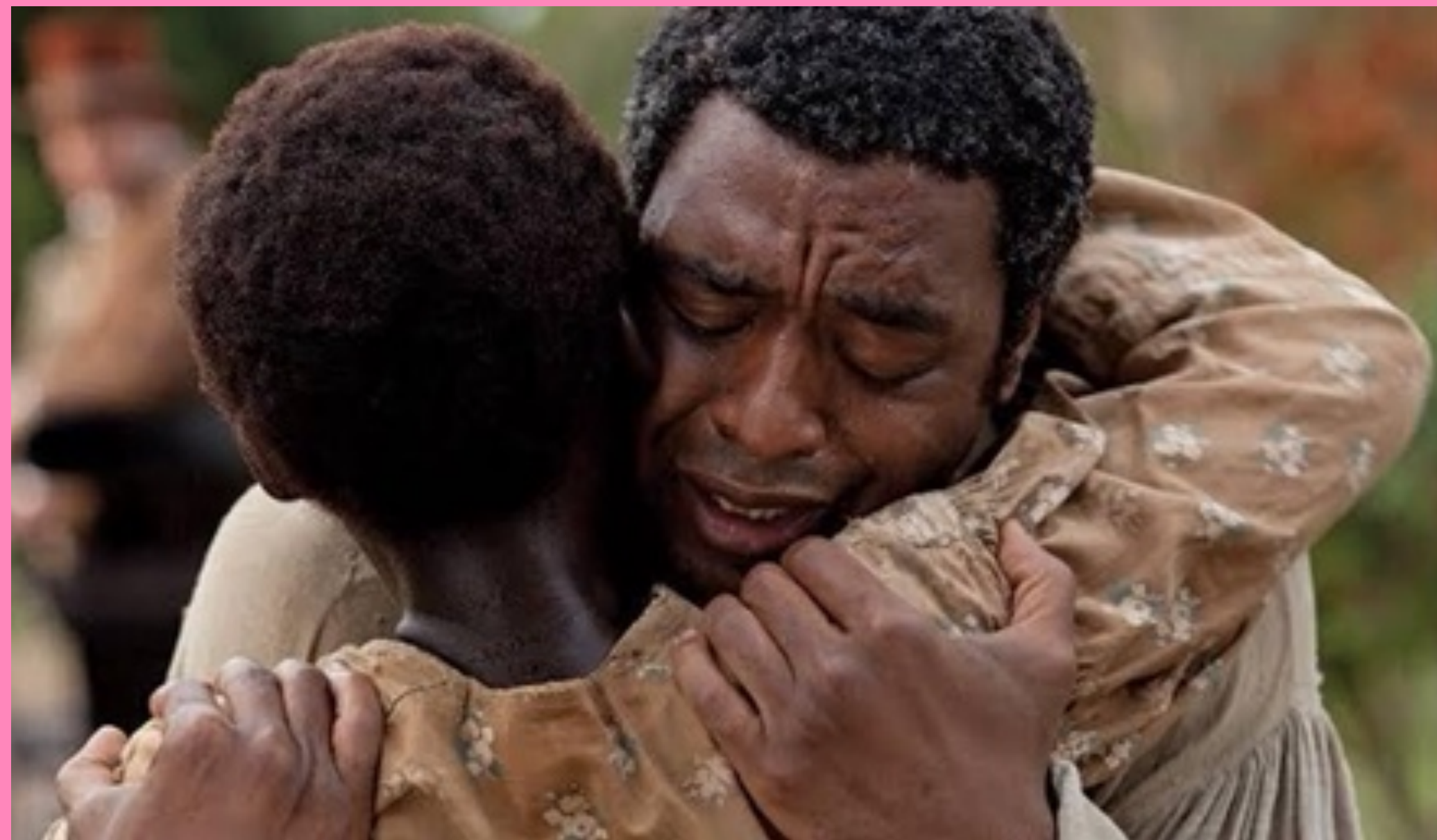
12 ANOS DE ESCRAVIDÃO