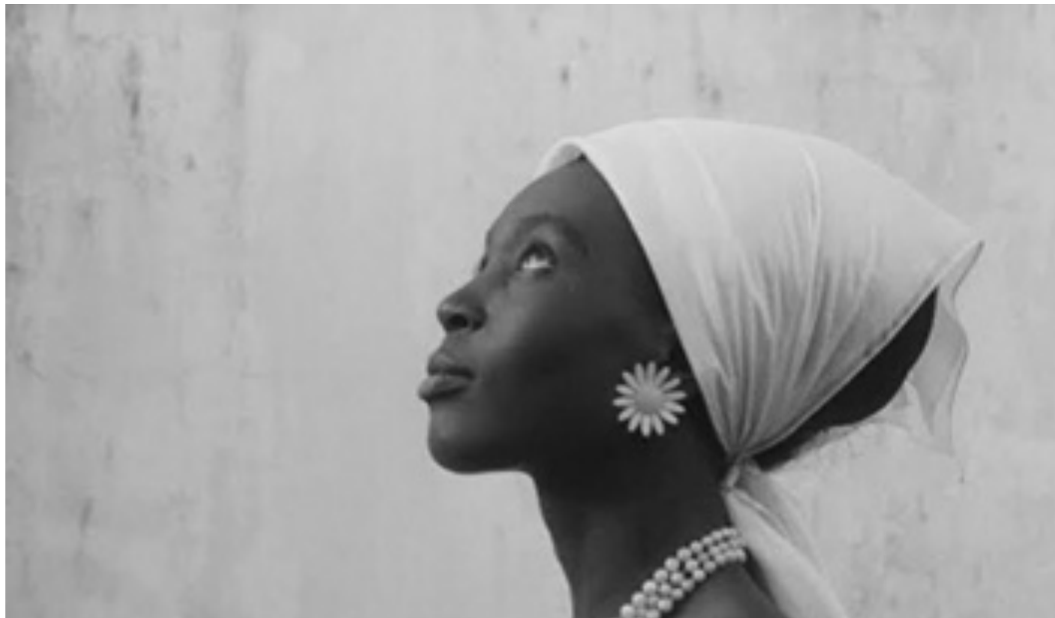
A NEGRA DE