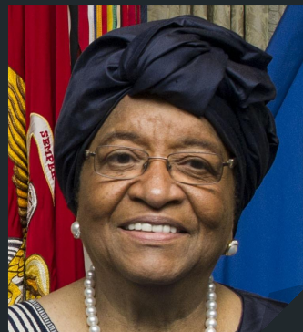
ELLEN JOHNSON SIRLEAF