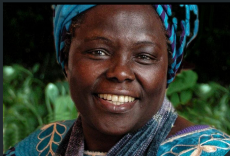
WANGARI MUTA MAATHAI