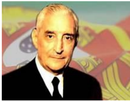
Antônio de Oliveira Salazar: